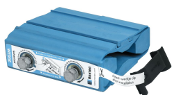
Klínové těsnění a souprava klínových těsnění Roxtec